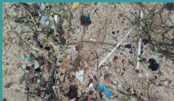
Microplastiques dans la laisse de mer

Dans la Manche, les déchets issus des activités ostréicoles comme les poches à huîtres sont les déchets les plus nombreux. Il convient donc de s'interroger sur les actions à mettre en œuvre pour diminuer la source de ces pollutions.