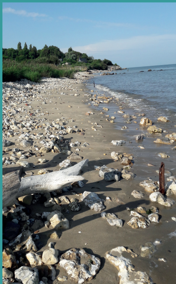
Site de suivi des macro-déchets sur le littoral calvadosien à Cricqueboeuf

Protecting and conserving the North-East Atlantic and its resources